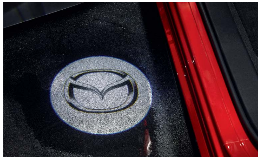
LED osvětlení vozovky s logem Mazda