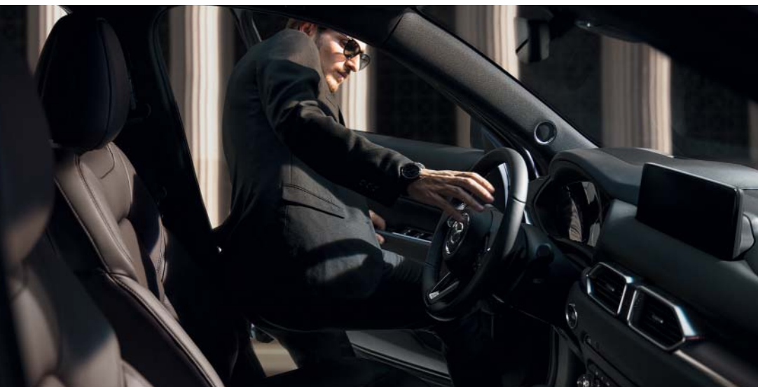
Mazda CX-5 v barvě Soul Red Crystal.

Díky přístupu designéra založenému výlučně na pocitech a emocích pocítíte s vozem 2021 Mazda CX-5 pocit naprosté jednoty, jenž vám zaručí bezstarostný a podmanivý zážitek z jízdy.