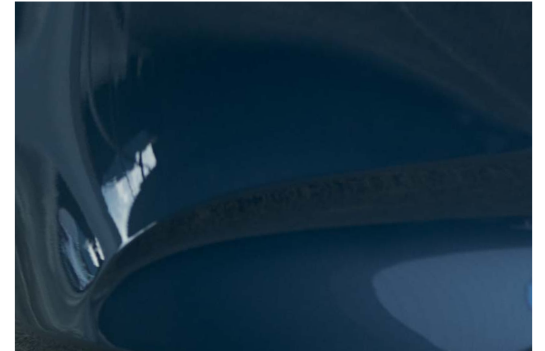
Polymetal Gray Metallic