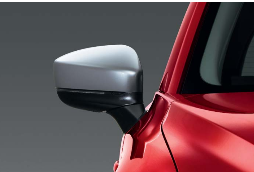
Stříbrná krytka vnějšího zpětného zrcátka

Užitnou hodnotu vaší 2021 Mazdy CX-5 dále zvýší propracované originální příslušenství.