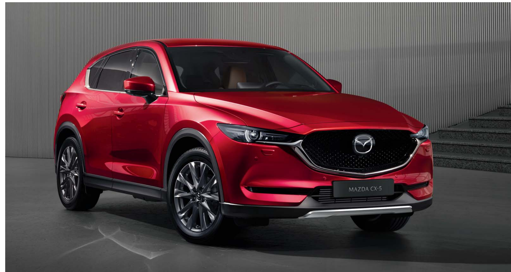
Přední a zadní lišta v matné stříbrné úpravě