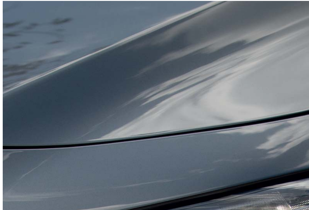
Šedá Machine Gray

Navštivte naše internetové stránky a prohlédněte si všechny dostupné úžasné barevné varianty.