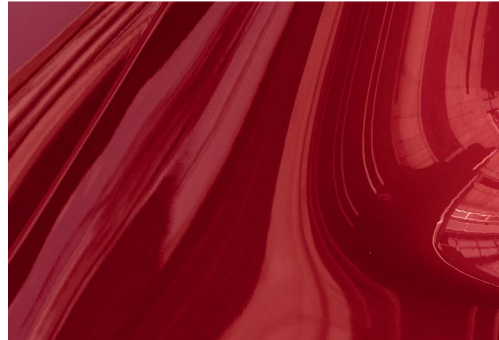
Soul Red Crystal